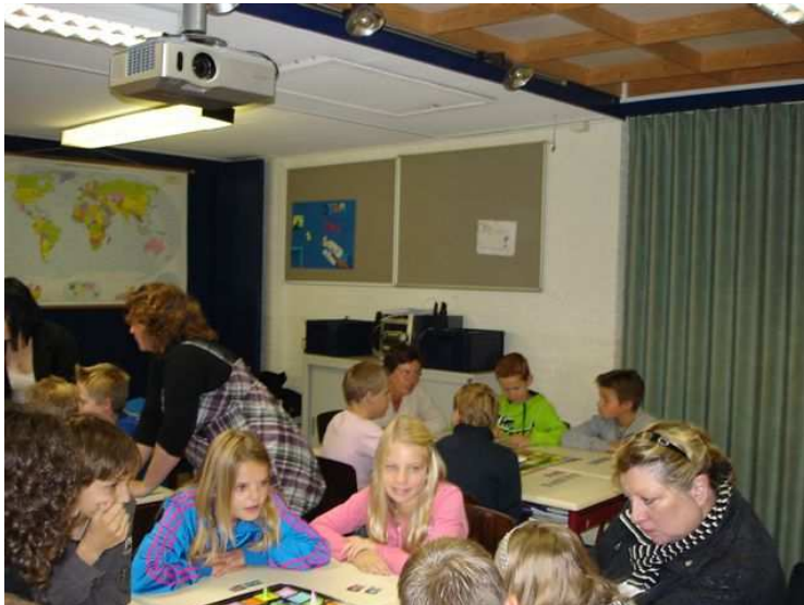
Bling bling spel op de Joris basisschool